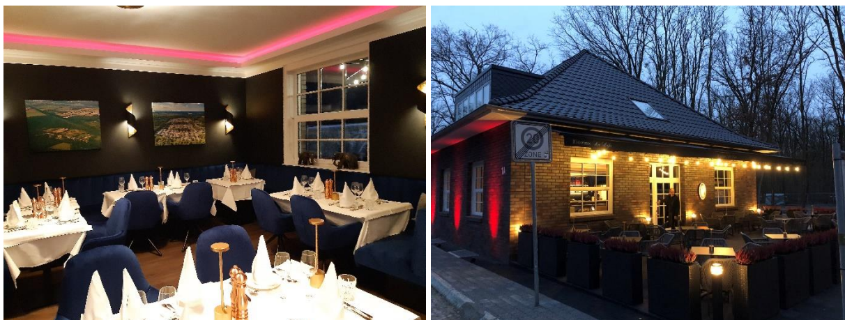
Restaurant La Lupo

Thema Waldsiedlung: Trafohaus – Groß Glienicke