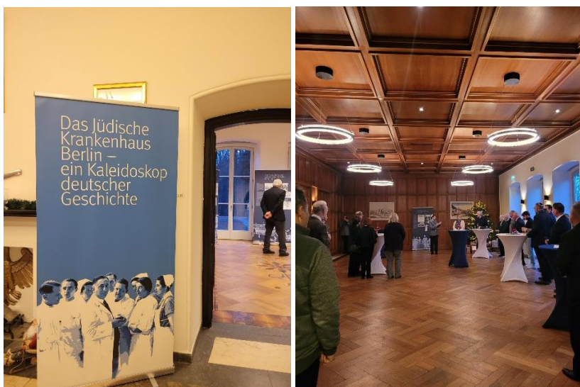
Ausstellungseröffnung „Jüdisches Krankenhaus Berlin“